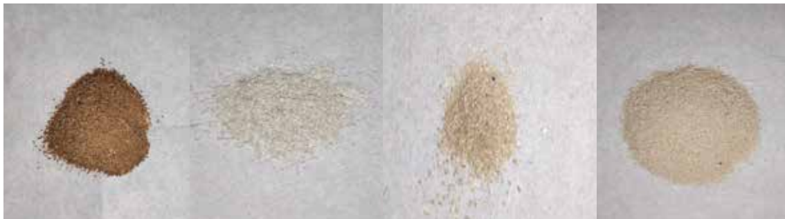
Gambar 1. Hasil MCC Teratai Putih dari Bunga, Tangkai Bunga, Daun, dan Tangkai Daun

Pada MCC bunga teratai putih berwarna coklat tua, MCC tangkai bunga berwarna putih kekuningan, sedangkan MCC daun dan tangkai bunga berwarna coklat muda. Berdasarkan bentuk MCC yang diperoleh diantara semua bagian teratai putih, MCC bunga teratai putih memiliki bentuk serbuk yang lebih kasar dibandingkan bagian teratai lainnya.