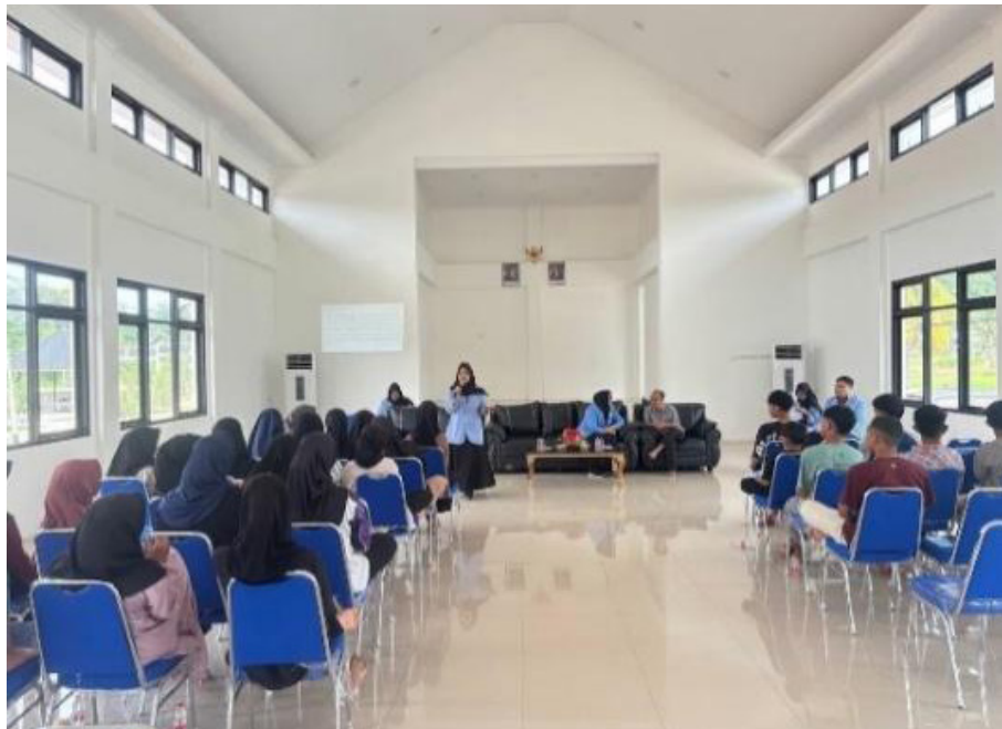
Gambar 3. Sesi penyampaian materi Pertolongan pertama

Gambar 3 memperlihatkan suasana saat pemateri menjelaskan definisi hingga bagaimana cara pelaksanaan pertolongan pertama. Di dalam gambar tersebut, peserta fokus memperhatikan penjelasan yang disampaikan oleh pemateri dan menunjukkan antusiasme serta minat mereka terhadap materi yang diberikan. Suasana pelatihan berjalan dengan tertib dan interaktif, sehingga kegiatan pada sesi ini berlangsung dengan sangat lancar dan sesuai dengan yang direncanakan.