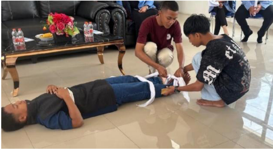
Gambar 4. Sesi Simulasi Praktik melakukan pertolongan pertama

Pada gambar 4 dilakukan sesi simulasi penanganan korban dan bagaimana tatalaksana penggunaan alat pertolongan pertama, peserta didampingi oleh Tim panitia selama kegiatan simulasi dilakukan. Jenis pertolongan yang diajarkan mencakup cara membuka, menggunakan dan menutup kembali tandu. Peserta harus memahami bagaimana cara menggunakan peralatan pendukung pertolongan pertama seperti tandu, kompres es batu, mitela dan kayu penyangga.