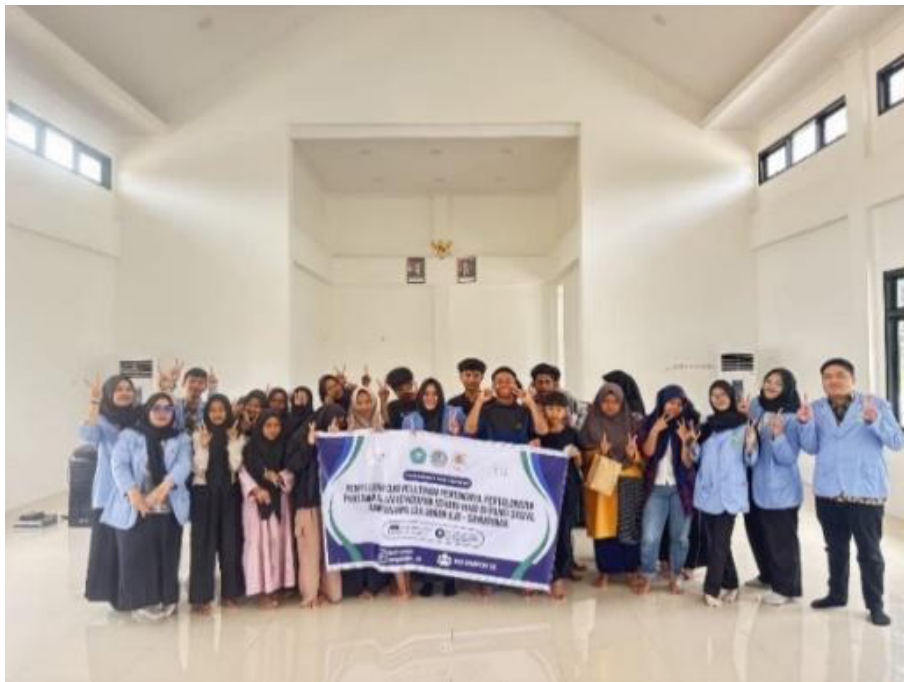
Gambar 5. Sesi Foto Bersama

Pada gambar 4 dilakukan sesi simulasi penanganan korban dan bagaimana tatalaksana penggunaan alat pertolongan pertama, peserta didampingi oleh Tim panitia selama kegiatan simulasi dilakukan. Jenis pertolongan yang diajarkan mencakup cara membuka, menggunakan dan menutup kembali tandu. Peserta harus memahami bagaimana cara menggunakan peralatan pendukung pertolongan pertama seperti tandu, kompres es batu, mitela dan kayu penyangga.