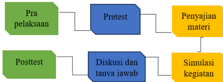
Gambar 1. Skema tahapan pelaksanaan

pengecahan luka semakin parah. Pelaksanaan penyuluhan mengenai pentingnya pertolongan pertama terhadap kehidupan sehari – hari dilakukan dengan tahapan berikut seperti terlihat pada Gambar 1.